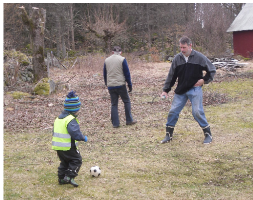
1: Fotbollsträning i Mulatorp!

slätterängen inför slättern! Sen blev det grillat och fotboll!