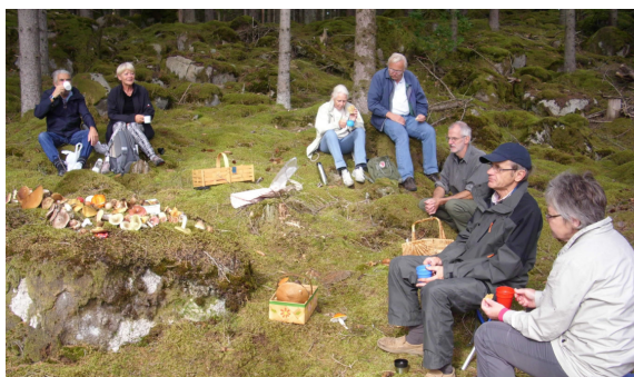
2: Fikapaus efter svampplockningen!

1 september. SVAMPENS DAG: Huvudarrangör: Sveriges Mykologiska Förening. SMF. Tillsammans med Jan-Åke Lönqvist åkte vi till skogarna norr om Olofström. Vi befarade dåligt med svamp, men hittade ovanligt mycket sopp!