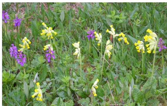
4: Blomsterprakt i slätterängen Komperskulla. 2013