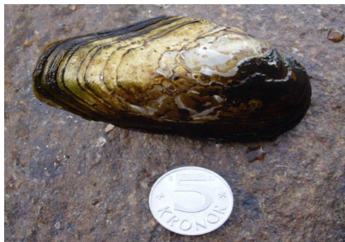
3: Allmän Dammussla från Raslängen!