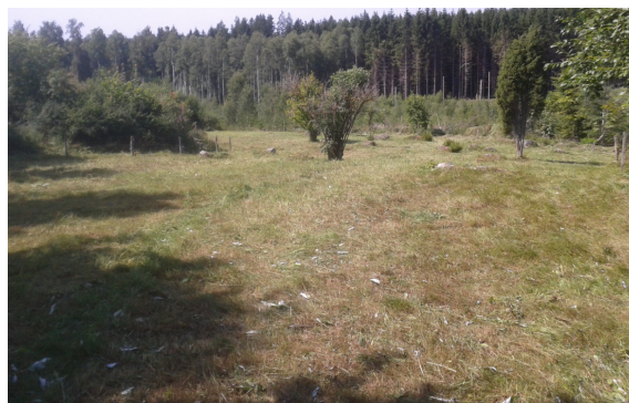
5: Nyslagen äng i Komperskulla. Augusti-2013