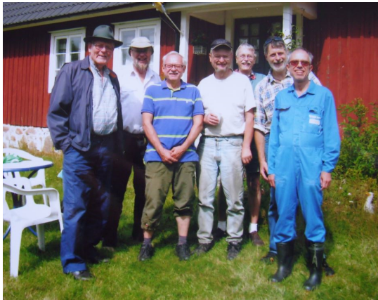
2: Glada slätterkarlar i Mulatorp.

7 st. ställde upp med gott humör. Gräset blev avslaget, och forslades bort med släp, draget av fyrhjuling!