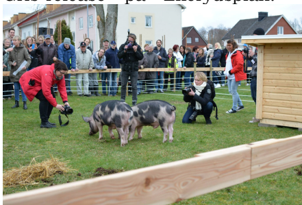
3: Gris-release på Ekerydsplan