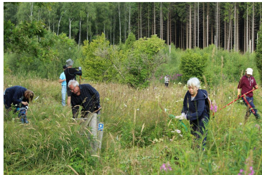
2: Ängens dag i Komperskulla.