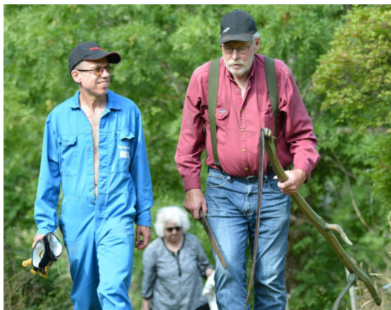
1: Slätterkarlar och räfserska i Mulatorp.

1 augusti. ÄNGENS DAG i Komperskulla: 10-tal medhjälpare slog och räfsade slätterängen. Bra hjälp från Karlshamns-kretsen. Soligt och fint.