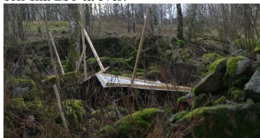
Naturens sätt att sabotera vår verksamhet Fårens regnskydd efter julstormen! ☺

Den sedvanliga fagningen, slåttern på Ängens Dag och slybekämpning har utförts under året. Vi bekostade och byggde ett regnskydd till fåren, på önskemål från får-ägaren. Det blev och såg bra ut fram till stormen kom under julhelgen, då hela "bygget" flög iväg! Fåren, 5 tackor betade maj-juni i betesmarken och efter slåttern i ängen från den 11/8 och 45 dagar framåt. Vi inköpte ett nytt el aggregat (Bandhini 14000) till stängslet, som LSt betalade. (3000 + moms) Det gamla aggregatet slukades ju i lågorna året innan. En "ny" bod i form av en container är på plats, där el aggregatet är monterat, så vi fick gräva ner ny ledning till stängslet. Boden fixade OK Vilse med hjälp av Lars-Erik Larsson. En låst vägbom är nu på plats, samt lås på boden, som vi har nyckel till. Angående framtida skötsel av Komperskulla kommer vi att sköta det administrativa jobbet med ängen tills EU-avtalet går ut om något år, sen ska LST ta över.