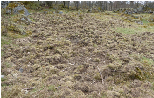
Vildsvins-kultivering (-fagning) i Mulatorp. ☺

även under detta året har stängslingen för skogsbetet, som LSt ansvarar för, inte slutförts. LSt meddelade i december att under nästa år ska det eventuellt hamlas mer, stängsling vid Mulasjön ska sättas upp och en parkering kommer att göras i ordning längs med vägen till Mulatorp. Även vägen kommer att förbättras. Mulatorp är ju faktiskt ett naturreservat. Och det bör ju underlättas för besökare att ta sig dit. Tyvärr trivs lupiner och örnbräken för bra i ängarna på Mulatorp, men beteshållaren har ett avtal med LSt att bekämpa örnbräken i alla fall.