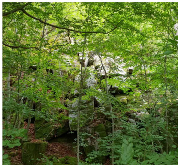
Sluttning intill slalombacken.

Vår web-sida: Olofströmsnatur som lanserades 2017, har under året utökats med fem nya naturområden. Vitavatten / Grytån / Orlundsån / Getatorpet / Sluttning-intill-slalombacken. Så nu är det 49 platser som presenteras med beskrivning av platsen och dess naturvärden i ord och bild.