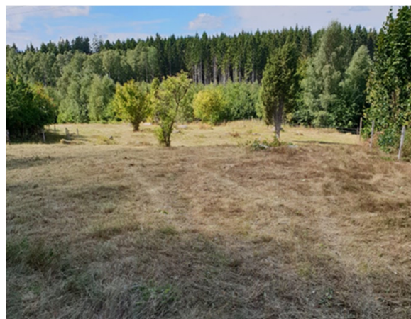
Nyslaget i Komperskulla slätteräng. 4/8-18

"Vår" slätteräng har skötts i vanlig ordning med fagning, slätter och slybekämpning. Eftersom ängen betas efter slätteren samt att det finns en betesmark i anslutning till ängen har det gått får och betat under året. Vi fick det stormfällda får-skjulet på plats, och vi fick förlänga och gräva ner ledningarna till el-stängslet då en ny byggnad uppförts där vi ska ha el-aggregatet monterat. Vi har bytt ut ett 20-tal stängselstolpar också.