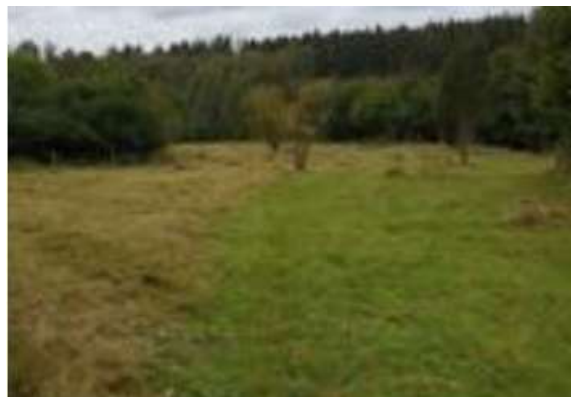
Komperskulla slåtteräng 13 sep

Komperskulla. Punka på slåtterbalken så det blev till att slå med lie. Vi var sju st. som ställde upp. Efter ett tufft pass i gassande sol käkade vi och lottade ut priser till alla deltagarna. Vi hann inte slå hela ängen. Fick fixa det senare i sept.