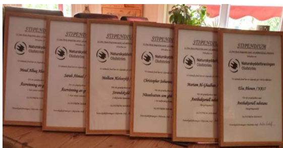
Stipendiediplom 2020