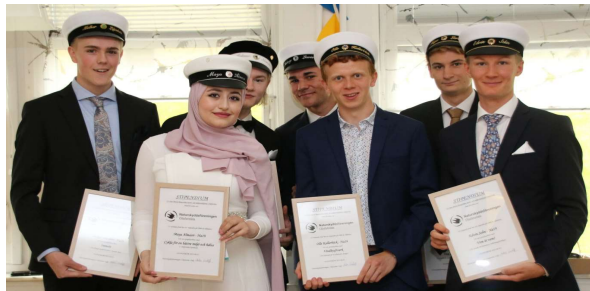
Stipendiaterna med sina diplom samlade.

Vindkraftverk: Olle Kallerbäck Na19. 1 000 kr