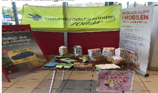
Presentation på Maxi, EKO-frukost.