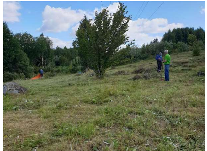
Slätterängen i Komperskulla

släpptes in i slätterängen på efterbete den 23/8 och betade där till den 3/10. Inget bete i den intilliggande hagen under 2022.