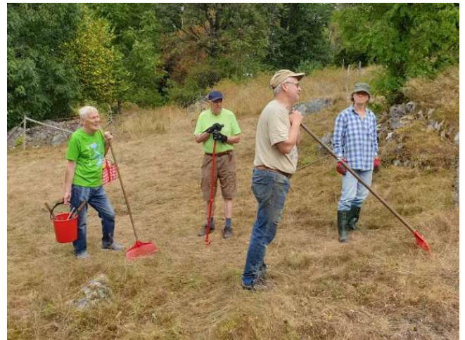
Slätterfolk i Mulatorp.

Har vi också som vanligt, fagat på våren och slagit slätterängen i mitten på augusti. (Se program.) Även för Mulatorp har vi nu tecknat ett nytt slätteravtal med Lst. Tyvärr har inga betesdjur funnits tillgängliga under året, så varken skogsbetet eller efterbetet i slätterängen har blivit av. En uggle-holk, en mulm-holk och två småfågel-holkar har vi satt upp i närområdet till ängen. Vi fick av Lst, slutrapporten på den kulturlämnings-inventeringen som gjordes sept-nov. 2021. Den 19/11 hade VBOF och Karlshamns Naturskyddsförening en skogsfågelsexkursion i naturreservatet Mulatorp, där vi också deltog.